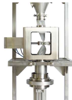
ピンチバルブ式計量充填装置